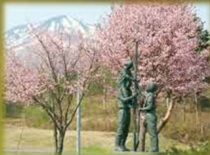
桜並木植樹記念像と岩木山