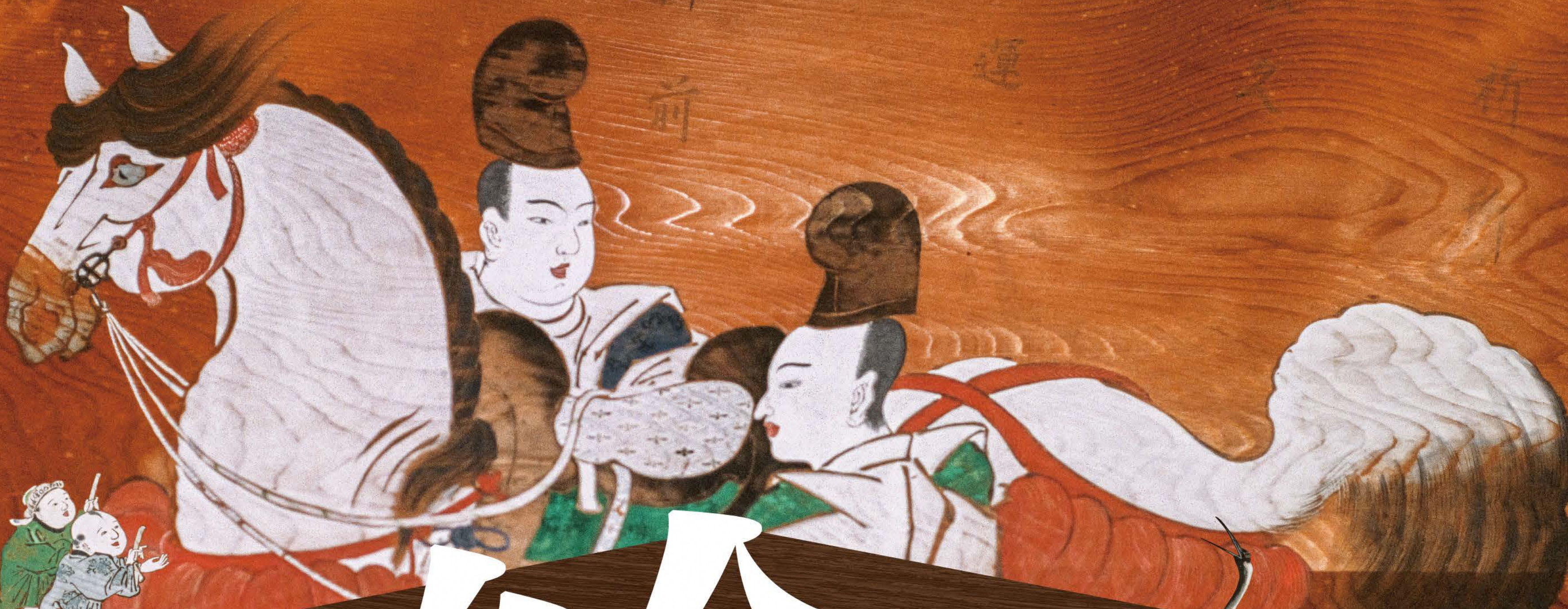
ひき馬図[白毛鞍置] (県有形民俗文化財、当館蔵)