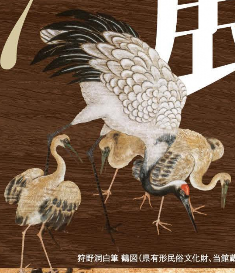
狩野洞白筆 鶴図(県有形民俗文化財、当館蔵)