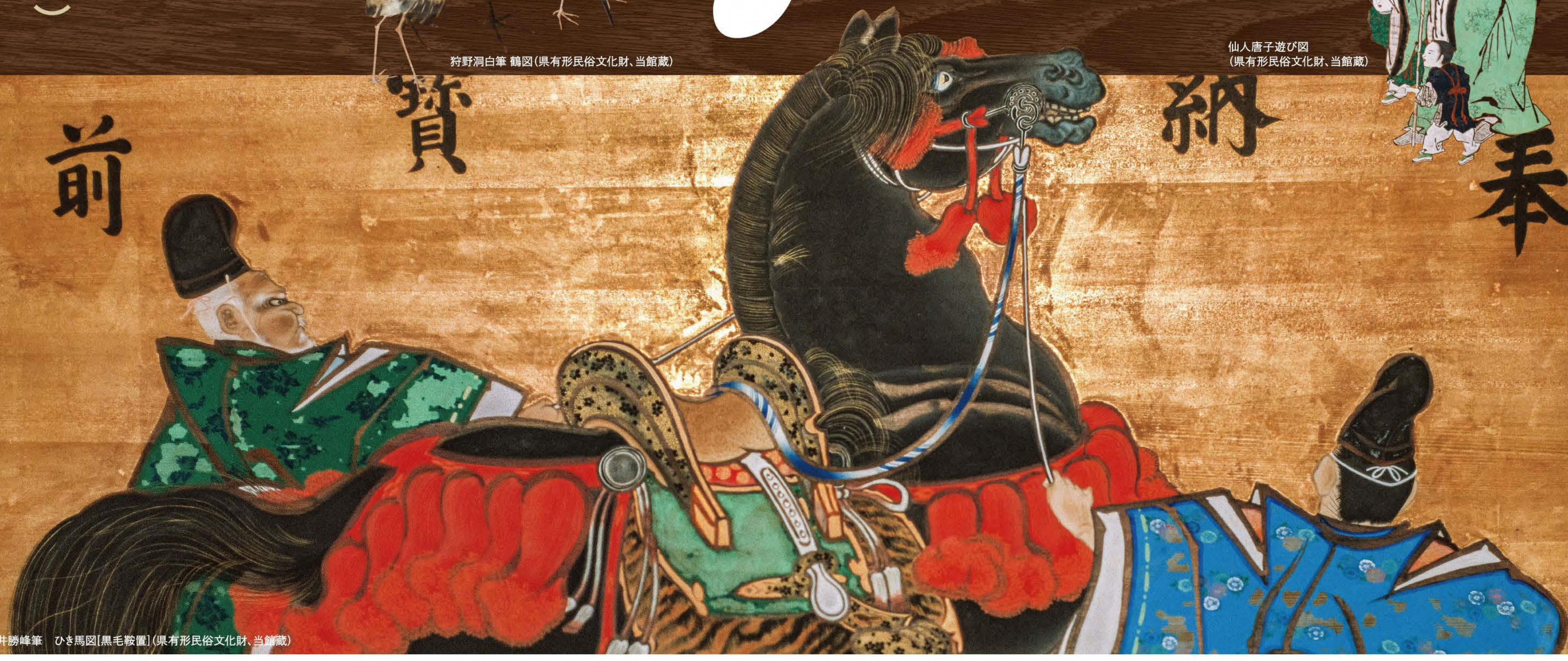
新井勝峰筆 ひき馬図[黒毛鞍置](県有形民俗文化財、当館蔵)

■ 観覧料 一 般 … 300円【220円】 高校・大学生 … 150円【110円】 小・中学生 … 100円【50円】 ※【 】内は20名以上の団体料金。※障がいのある方(介護者含む)、65歳以上の弘前市民、弘前市内の小・中学生及び外国人留学生、ひろさき多子家族応援パスポートをお持ちの方は無料です。※弘前市立博物館とのお得な共通券もあります。