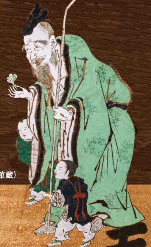
仙人唐子遊び図 (県有形民俗文化財、当館蔵)