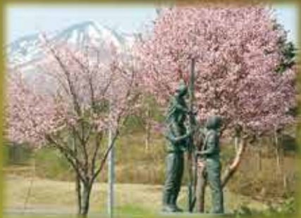
桜並木植樹記念像と岩木山