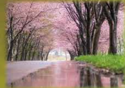
県道3号沿いの遊歩道と桜並木。