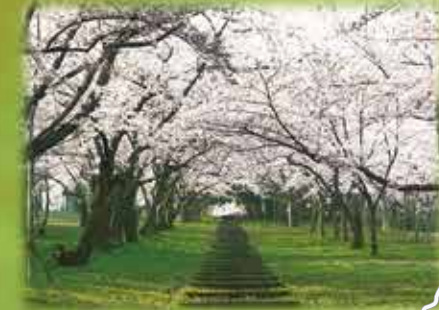
約千本のソメイヨシノが咲き誇る桜林公園。