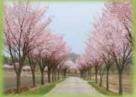
枯木平の桜並木道