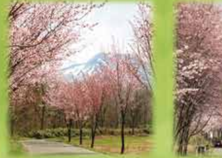
山麓を走る道によって様々に表情を変える桜並木。