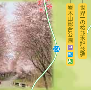
↓西目屋村・白神山地