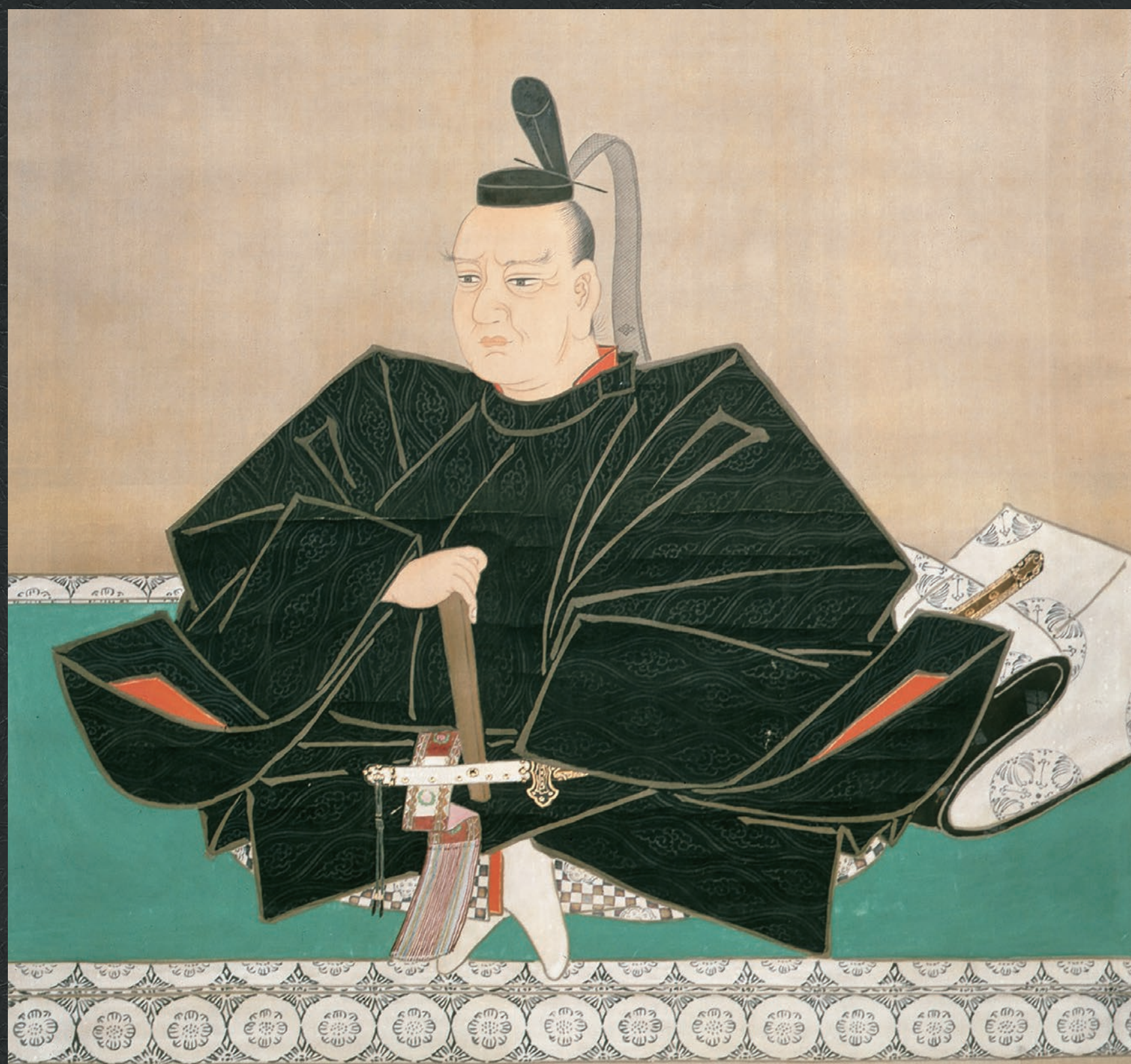
新井常償筆 津軽信政像(高照神社蔵)