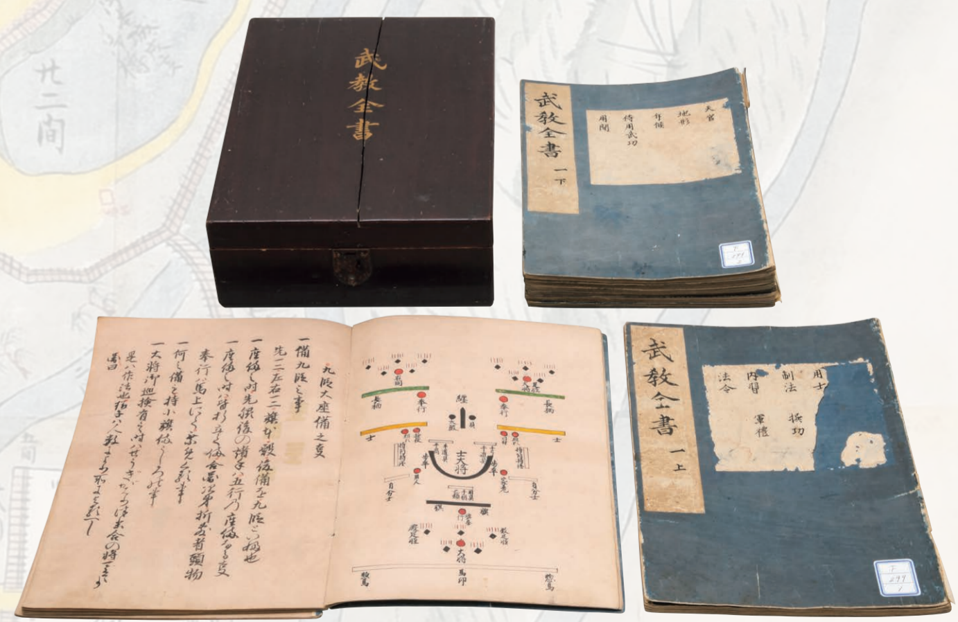
山鹿素行著・貴田元辰写 武教全書(当館蔵)