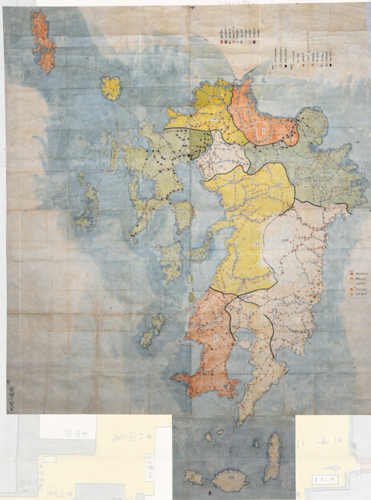
貴田元親写 九州二島図(市指定有形文化財、当館蔵)