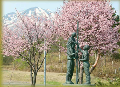
桜並木植樹記念像と岩木山