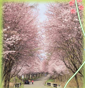
↓西目屋村・白神山地